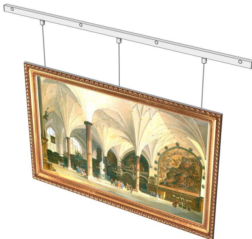
Ilustracja 1: Listwa do podwieszania obrazów LM-10